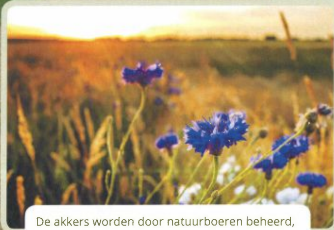
De akkers worden door natuurboeren beheerd, natuurlijk zonder gif. Hier staat het straks vol met o.a. korenbloemen.

landschap, Natuurmonumenten en Natuurbegraafplaatsen Nederland maakt voor de Bonnenpolder. Hier zie je een samenvatting van het plan. Informatie, de tekeningen én de animatie naar onze website.