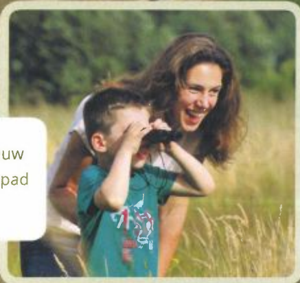
1,4 kilometer nieuw fietspad.