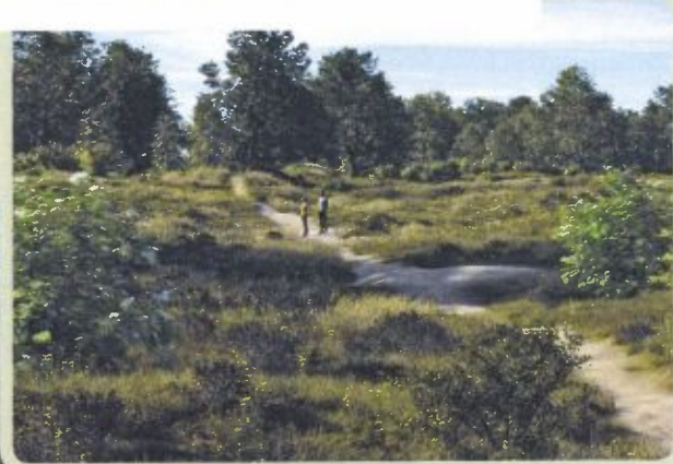
Een flinke strook extra duin en bos wordt direct aan het Staelduinse Bos aangelegd. Je wandelt zo vanuit het bos de polder in.